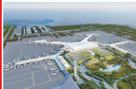
厦门翔安机场建设效果图。