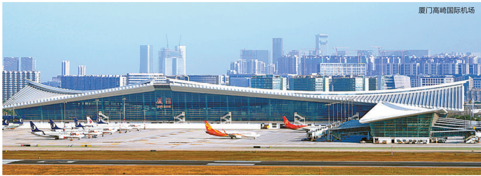
厦门高崎国际机场