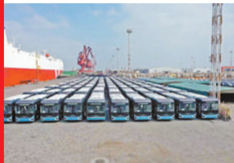
出口科威特的公交车。

10月7日,阔别四年的比利时世界客车博览会如期开幕,作为国内第一个登陆比利时世界客车博览会的中国汽车品牌,金龙连续9届参展。此次,金龙携3款智能纯电动车型再次参展,向世界展示中国在新能源和智慧交通方面技术。活动现场,金龙针对旅游客车、城市公交等多元化需求提供的全场景产品惊艳全场,其中,金龙C12E-12米纯电动公路车通过对电机的控制优化,整车能耗降低10%左右,续航可达350公里;金龙PEV9-9米纯电动公交车采用3300N·m的直驱大电机,提升动力性能,满足20%的爬坡性能;金龙PEV6-6米纯电动小巴整体综合效率较传统直驱车辆提升3%,有效提升续航里程,高效节能、经济实用。绿色低碳是实现高质量发展、走向未来的必由之路。金龙有关负责人表示,金龙将倚重技术创新、智能制造,引领中国汽车工业从“制造”向“智造”、从“速度”向“质量”转变,为共建“一带一路”国家可持续发展提供重要驱动力,赋能公共交通绿色低碳转型。