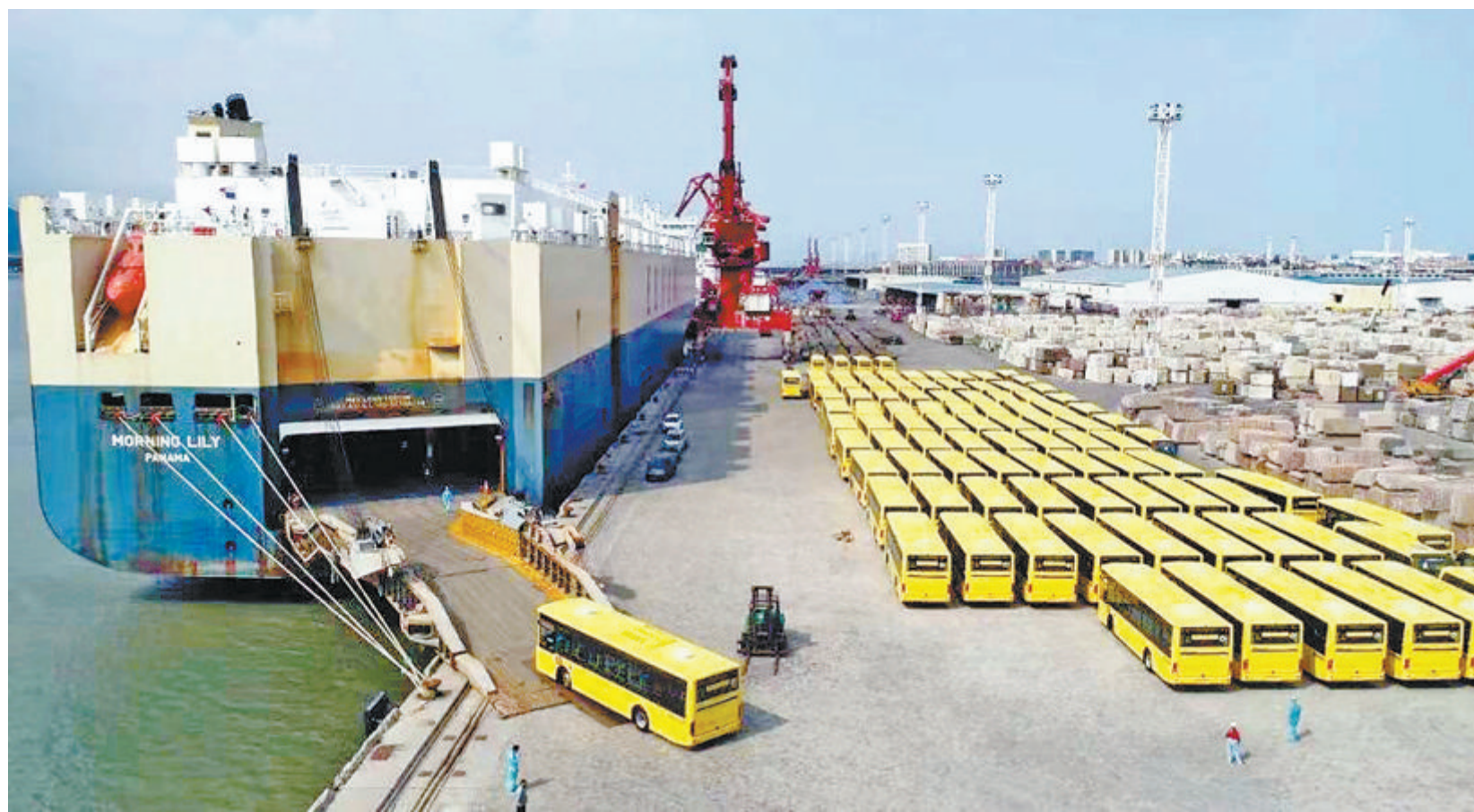
出口沙特阿拉伯的金龙智慧安全校车正在装船。