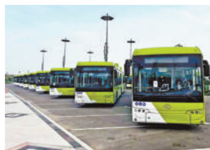
出口乌兹别克斯坦的18米BRT车辆。

从豪华大巴,到城市公交,再到护航学生的校车,十年来,金龙产品覆盖了115个共建“一带一路”伙伴大众交通生活的方方面面。