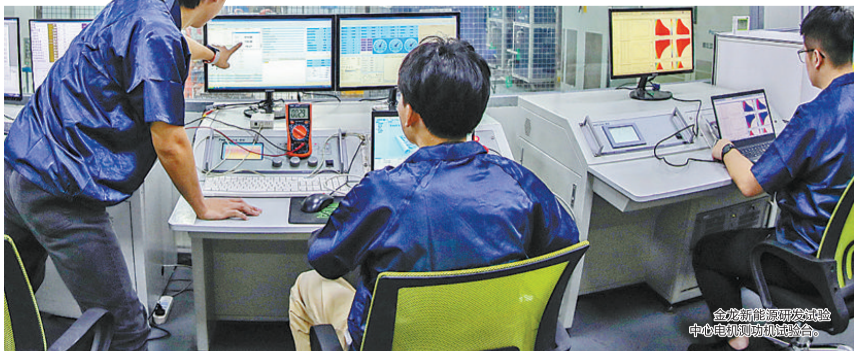
金龙新能源研发试验中心电机测试台。