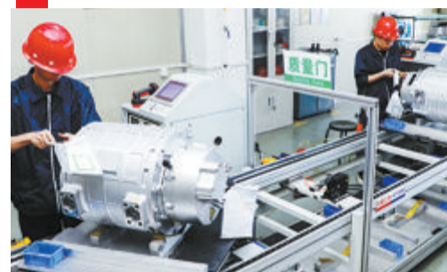
▲金龙新能源电机电控一体化生产线。

厦门金龙汽车新能源科技有限公司成立于2016年,专业从事新能源汽车关键零部件研发和生产,致力于打造国际领先的新能源商用车电驱动平台。