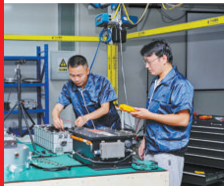
▲金龙新能源远程实操训练中心。

厦门金龙汽车新能源科技有限公司的产品主要包括整车控制、驱动电机、电机控制器、多合一集成控制系统、动力电池系统、电驱桥等一系列核心关键零部件。批量应用于微面、轻客、轻卡、重卡、公交、公路,涵盖插电式混合动力、纯电动、氢燃料客车等车型。