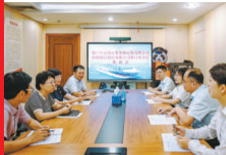
厦门中行深入企业调研和座谈,了解企业金融需求。

目前,中国银行已在境外64个国家和地区设立分支机构,可独立或协调专业机构为“走出去”的中国企业提供前站支持,通过境内外中行机构的跨境联动,提供包括政策咨询、跨境账户服务、全球统一授信、跨境担保、跨境结算、跨境投融资等在内的全流程金融服务。同时,中国银行可为“走出去”企业量身定制多时区、多币种、多业务、多渠道的全球现金管理服务方案,使其实现全球化、区域化、本地化的资金统一调拨和集中管理。此外,中国银行还可提供“走出去”企业外派员工提供海外代发薪、员工工资汇回、外汇汇兑等一揽子金融服务,满足“走出去”企业员工的个人金融服务需求。