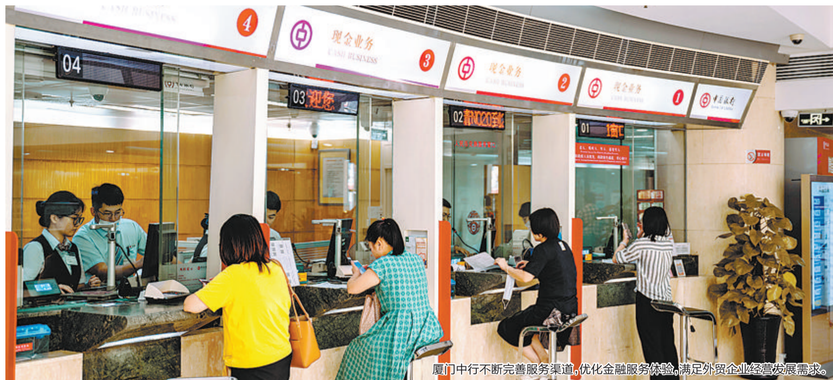
厦门中行不断完善服务渠道,优化金融服务体验,满足外贸企业经营发展需求。