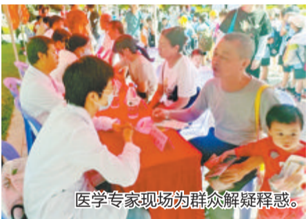
医学专家现场为群众答疑解惑。

本报讯(文/图 通讯员 柯勤 记者 楚燕)10月13日是“世界保健日”，今年的主题是“弘扬健康意识，倡导健康生活”。当天上午，厦门市保健服务中心在中山公园举办世界保健日健康宣教咨询活动，来自我市各大医院及市疾控中心、厦门市医师协会健康保健医师分会的20多位医学专家现场提供志愿服务，为群众答疑解惑。