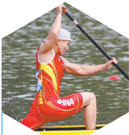
林文君:划艇亚运会冠军、奥运第6名

厦大帆协下辖帆板队,在主教练谈广言的带领下,在海内外多项帆船赛事中取得荣誉,自建队以来5次获得全国大学生帆船比赛冠军,4次代表中国大学生赴法国、新加坡、澳大利亚、意大利等地参加世界级帆船赛事,同时在中国杯帆船赛、中国俱乐部杯帆船挑战赛等大赛中表现不俗。2019年,谈广言还担任第30届那不勒斯世界大学生夏季运动会中国代表团帆板队领队兼教练。