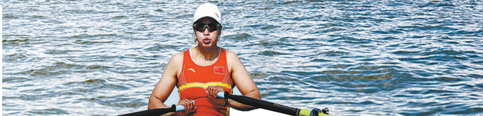
段静莉:赛艇亚运会冠军、奥运季军

厦门市水上运动66年的发展历史中,共培养了段静莉等7位奥运选手、陈秋斌等5位世界冠军、黄志鹏等7位亚运会冠军、林文君等7位亚锦赛冠军、林波等9位全运会冠军和吴志福等9位青运会(城运会)冠军。此外,黄永泽等53人124次获全国锦标赛冠军,向福建省队输送了134名优秀运动员,其中30人入选国家集训队。