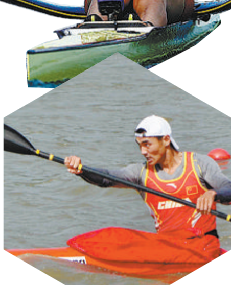
黄志鹏:皮艇亚运会冠军、奥运第8名