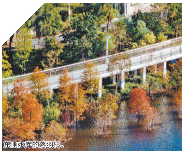
东山水库的落羽杉。

>>>小贴士: 可以乘坐BRT到东坪山庄站下车,到空中步道,沿着步道走大概2公里就可以到这片环廊;也可打车到东山水库站,随身还可以带上驱蚊液、花露水等物品。