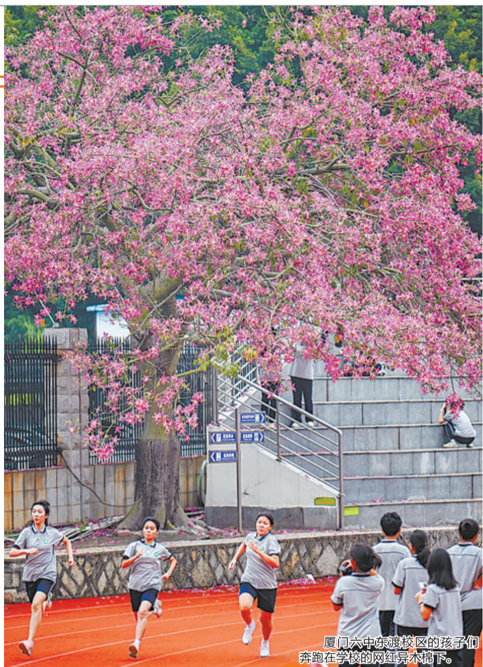
厦门六中东渡校区的孩子们奔跑在学校的网红异木棉下。