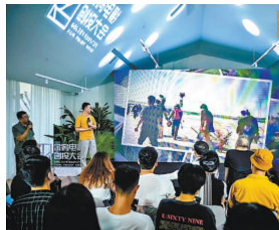
活动现场入选项目导演做拍摄心得分享。

本报讯(文/记者 郭秀君)21日,2023金鸡创投·样片实验室杀青仪式在厦门园博苑成功举办。来自电影行业协会的相关负责人、国贸控股集团相关负责人、本届金鸡创投·样片实验室的三位导师、入选本届金鸡创投·样片实验室的五个剧组代表以及部分高校影视专业的师生共聚一堂,现场观看杀青样片,听取入选作品导演分享创作心得以及导师点评,助力青年影人成长。