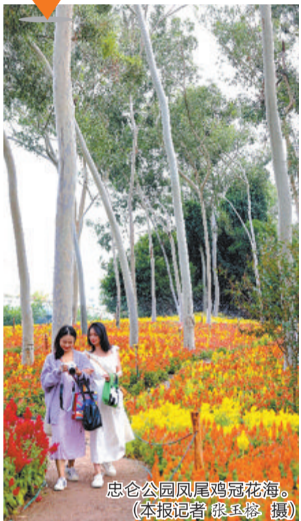
忠仑公园凤尾鸡冠花海。