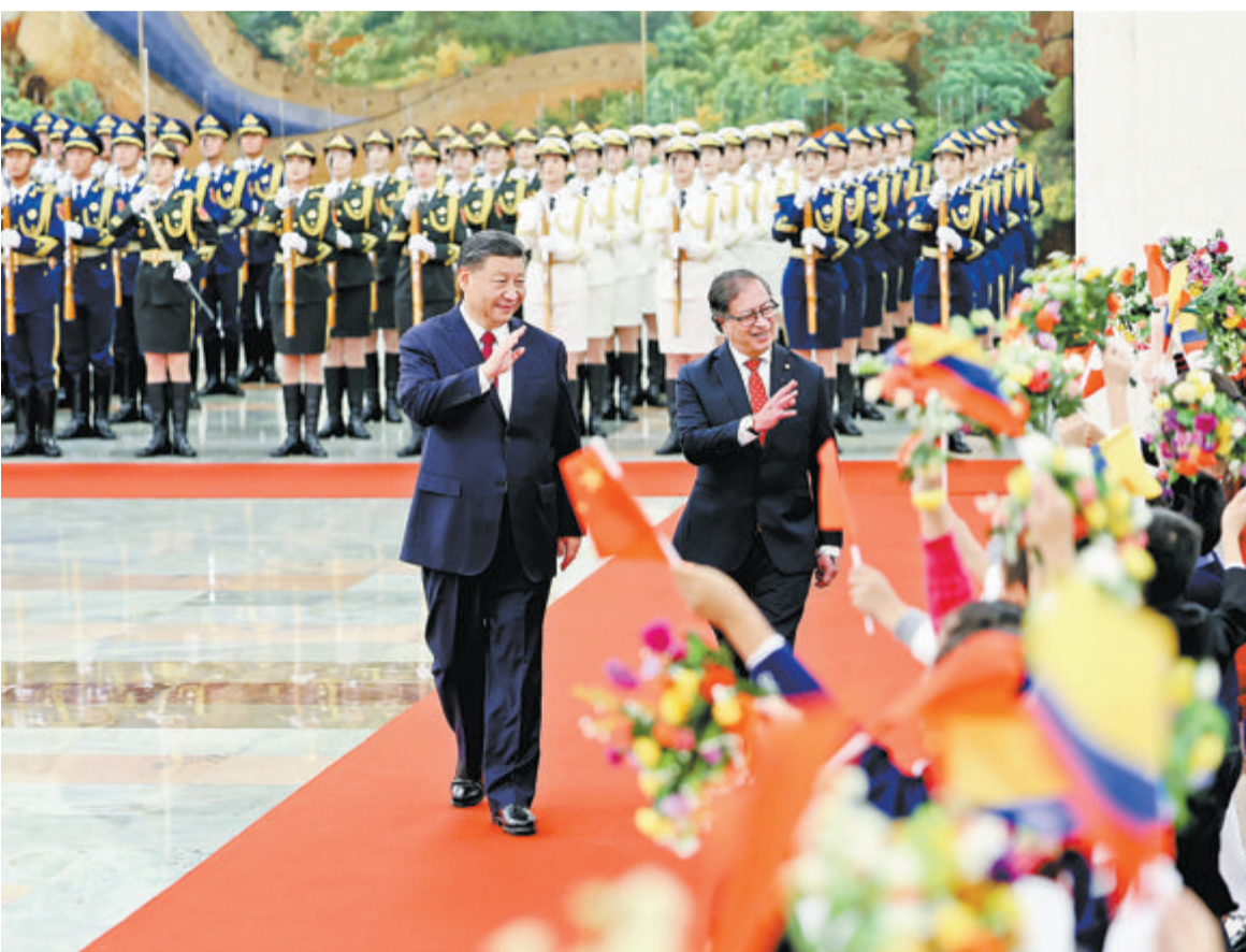
10月25日下午,国家主席习近平在北京人民大会堂同来华进行国事访问的哥伦比亚总统佩特罗举行会谈。这是会谈前,习近平在人民大会堂北大厅为佩特罗举行欢迎仪式。