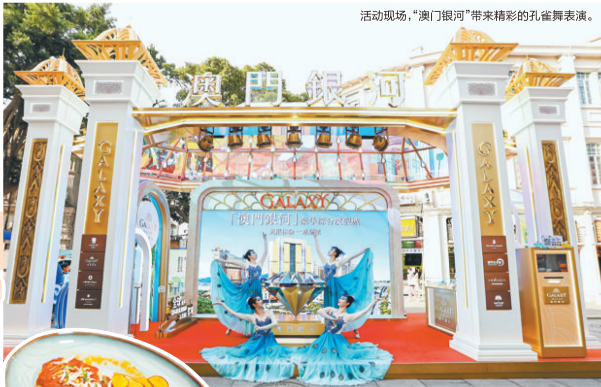
活动现场,“澳门银河”带来精彩的孔雀舞表演。

文/本报记者 陈秋莹 图/本报记者 黄少毅 由澳门特别行政区旅游局主办的“福建·厦门澳门周”于10月26日至30日在思明区中山路步行街举行。“澳门银河”综合度假城全力支持和参与澳门特区政府的路展活动,在中山路设置了恢宏气派的展位,更与澳门旅游局、厦门安达仕酒店共同举办“双门相遇探索味蕾‘澳’秘”美食推广活动,全力展现澳门美食文化的丰富内涵。活动还得到福建省泉州市德化县及澳门啤酒的大力支持。