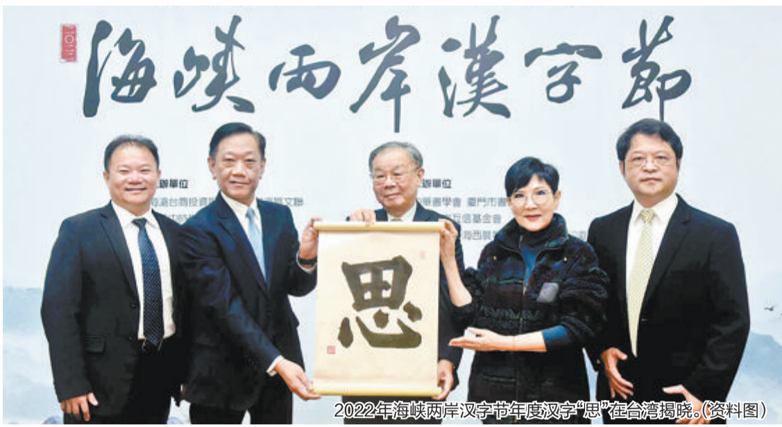
2022年海峡两岸汉字节年度汉字“思”在台湾揭晓。(资料图)

今天上午,在两岸嘉宾的共同见证下,2023海峡两岸汉字节将在海沧区文化中心正式拉开帷幕。汉字节期间,主办方将开展年度汉字评选、汉字文化旅游主题线路征集体验等一系列文化交流活动,拓展两岸基层人文交流。 海峡两岸汉字节暨两岸年度汉字评选活动发源于2008年,2014年落户海沧,现已成为海峡两岸影响最广泛的文化交流活动之一。汉字节由国台办交流局、海沧台商投资区管委会、厦门市文联等指导,海沧区委宣传部、海沧区文联、厦门日报社、旺旺中时传媒集团等主办,海西晨报、台湾工商时报、新浪网、厦门市书法家协会、台湾中华书学会等承办,秉持“汉字文化搭桥,书写两岸民意”宗旨,持续以两岸年度汉字评选为主体,配套举办书法笔会、汉字创意大赛等两岸交流活动,深挖汉字文化内涵,弘扬中华优秀传统文化,有力促进两岸交流,增强两岸文化认同。