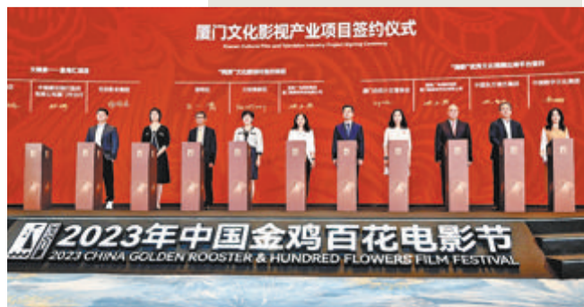
▲厦门文化影视产业项目签约仪式现场,厦门建行与文娱家-星海汇(厦门)数字文化产业投资合伙企业进行签约。