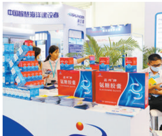
往届海洽会上,参展商展示海洋产品。

此外,今年的厦门海洽会与2023中国(厦门)国际休闲渔业博览会同期举办,两场展会相互延伸补充,专业与趣味并存,形成了良好的联动效应,更好地整合资源优势,共同打造有特色、高水平的海洋与渔业盛会。