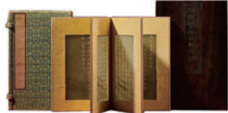
▲清乾隆 御制《佛说贤者五福德经》玉册

本报讯(通讯员 郑飞白)保利厦门2023秋季拍卖会自11月1日起在厦门瑞颐大酒店举行预展,今日结束,将于4日—5日举行正式拍卖,延续以往高品质的标准与传统,带来一场融汇古今、集萃中外的艺术活动。