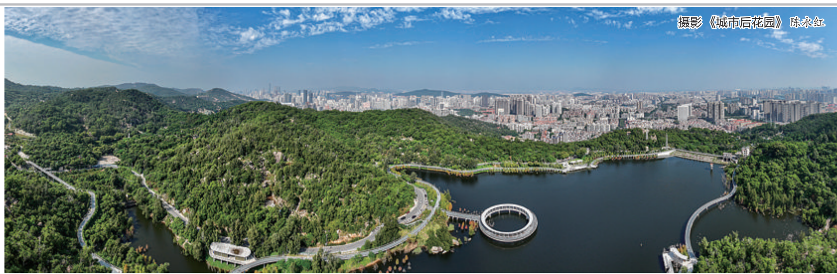
摄影《城市后花园》陈永红