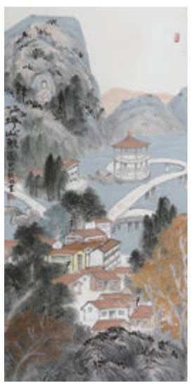
国画《坪山秋水》卢赣湘