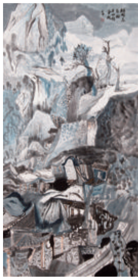
国画《半山借金枝》郑大群