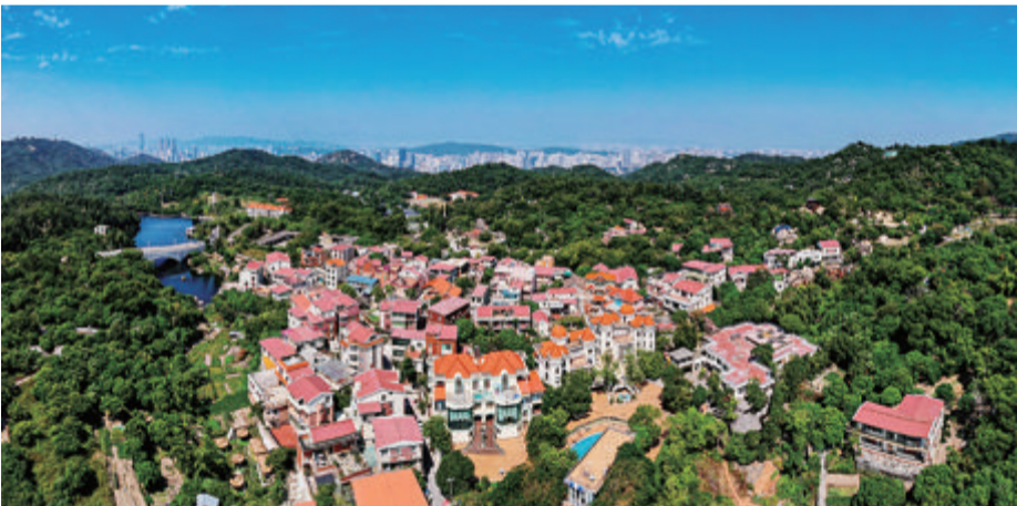
摄影《村中别墅》张妙音

“东坪山片区发展提升工作已经取得阶段性成果,今年开始进入第二阶段的工作,我们将进一步提升人居环境、完善基础设施、带动产业提升、赋能智慧管理、建设和谐社区,打造厦门市首批城中村样板示范村。”莲前街道相关负责人表示。据介绍,今年来,我市开展城中村现代化治理工作,并筛选出一批城中村作为治理试点,打造精品样板示范村,而东山东坪山就是思明区的两大试点之一,正在以“生态景区、休闲客厅、旅游目的地”为定位,努力实现“产业现代化、治理现代化、人的现代化”。