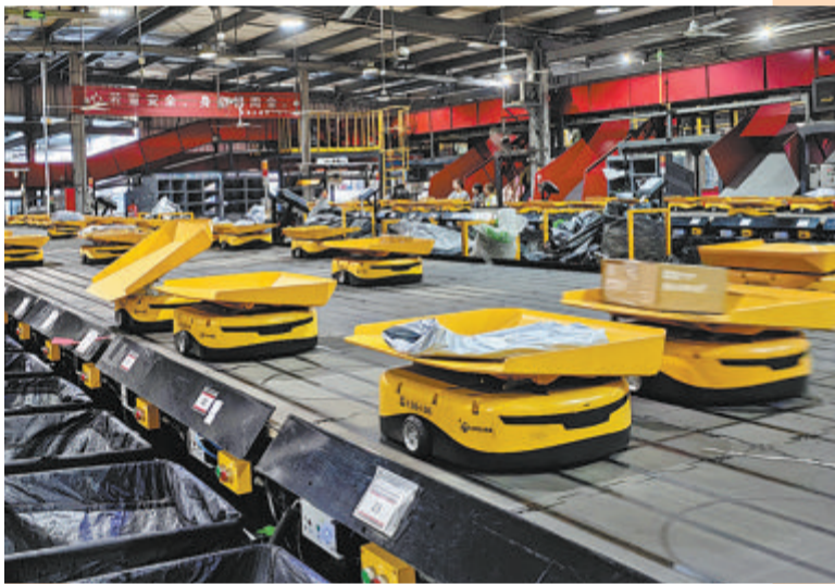
▼顺丰小件包裹分拣机器人自动分拣快递。