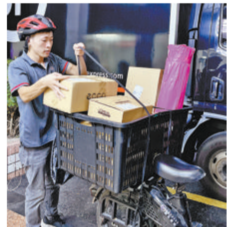
快递公司加大人员和车辆投入。(本报记者 许晓婷 王玉婷 摄)

圆通的快件运输车辆这段时间由平时的95辆增加到113辆,另加10辆作为机动增援保障。“快递小哥加班加点高频次派送,由平时每天派送2趟增加到3、4趟,提升派送时效。”其工作人员介绍。此外,厦门德邦快递整体派送网络提速,还可根据商家需求提供直发服务。