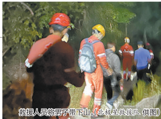
救援人员将男子带下山。

救援队员和民警只好根据照片判断男子所处的大致方位,一边往该方位搜索,一边大声喊话。