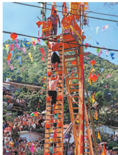
民俗活动“爬刀梯”表演现场。

本报漳州讯(文/图 特派记者 黄树金)连日来,在“福建省金牌旅游村”之誉的漳州市云霄县楼树村文化广场,云霄县有名的民俗活动“爬刀梯”(又称“上刀山”)“下火海”“热油洗身”等民俗文化活动期间10年再次上演,逾万名游客前往观赏。