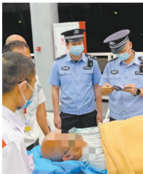
高崎边检站为患病船员开通紧急救助通道。

昨日下午,记者获悉,该名患病船员已脱离危险,正在医院接受治疗。高崎边检站高效、便民的服务举措为患者赢得了宝贵的救治时间,得到了船员与船方的赞赏。