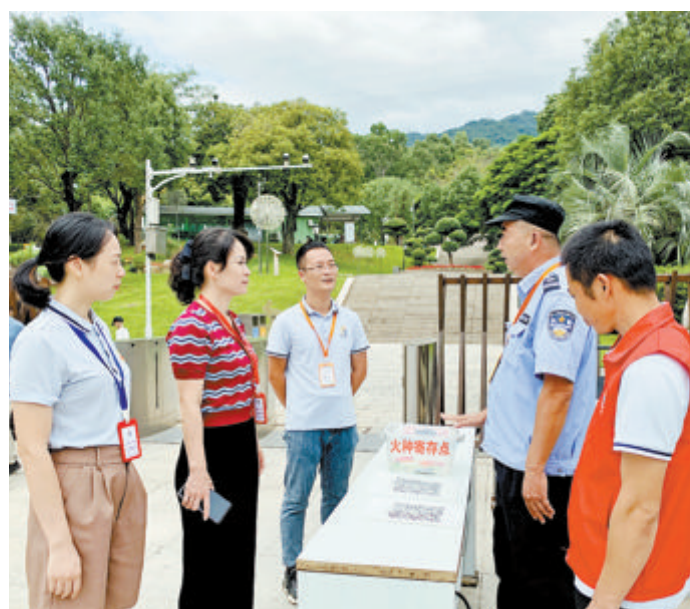
海沧城建集团纪委工作人员深入一线开展现场督查。

“秋天气候干燥,近期气温也还是比较高,森林防火工作丝毫不能马虎。”海沧城建集团纪委工作人员告诉记者,在为期一个月的秋冬季森林防火宣传月活动中,海沧城建集团纪委联合职能部门靠前监督,紧盯防火检查、防火宣传、监控系统检测、林下可燃物清理、安全培训和应急演练等各项工作,深入一线开展现场督查,发现问题立行立改,督促各相关单