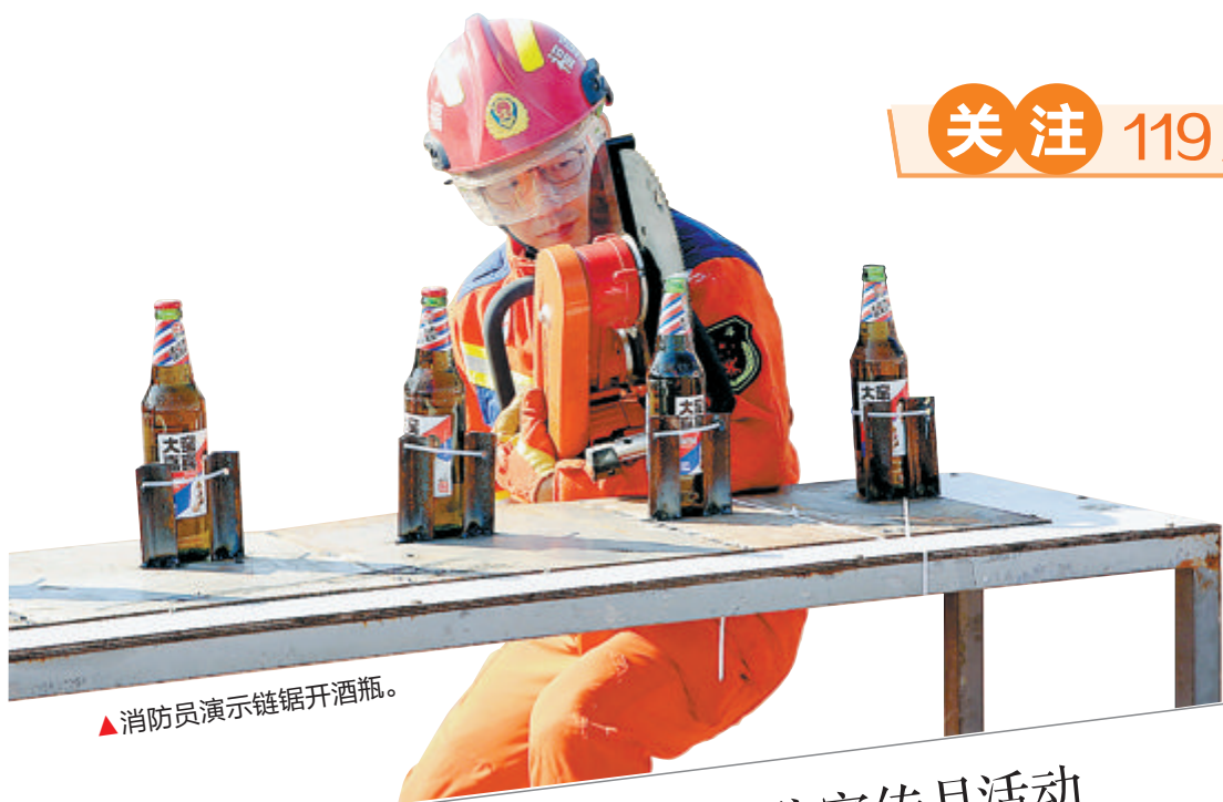
▲消防员演示链锯开酒瓶。