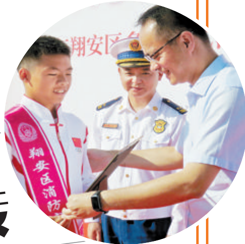
▼亚运冠军陈梓桓(左)为翔安消防安全代言。