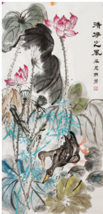
清静之风 庄思明画