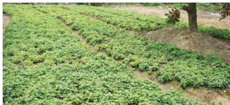
东山县南山村人种植的仙草。