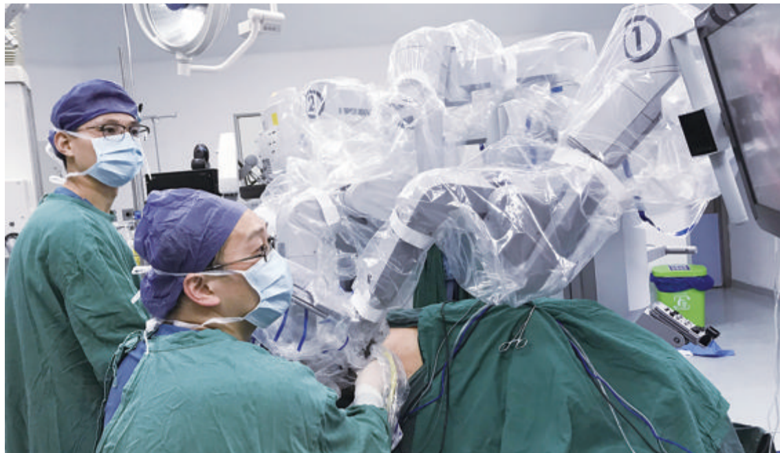
■第一医院开展机器人手术将近1400台，迈入人机高度融合的新时代。