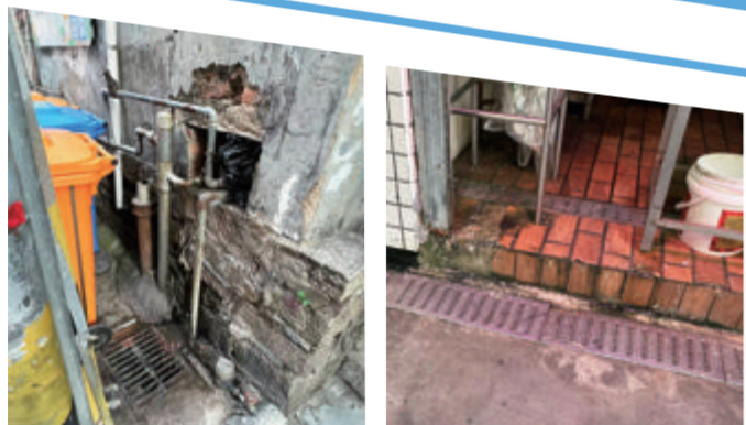
垃圾投放点后方成卫生死角。 73号摊位后方地面脏污。