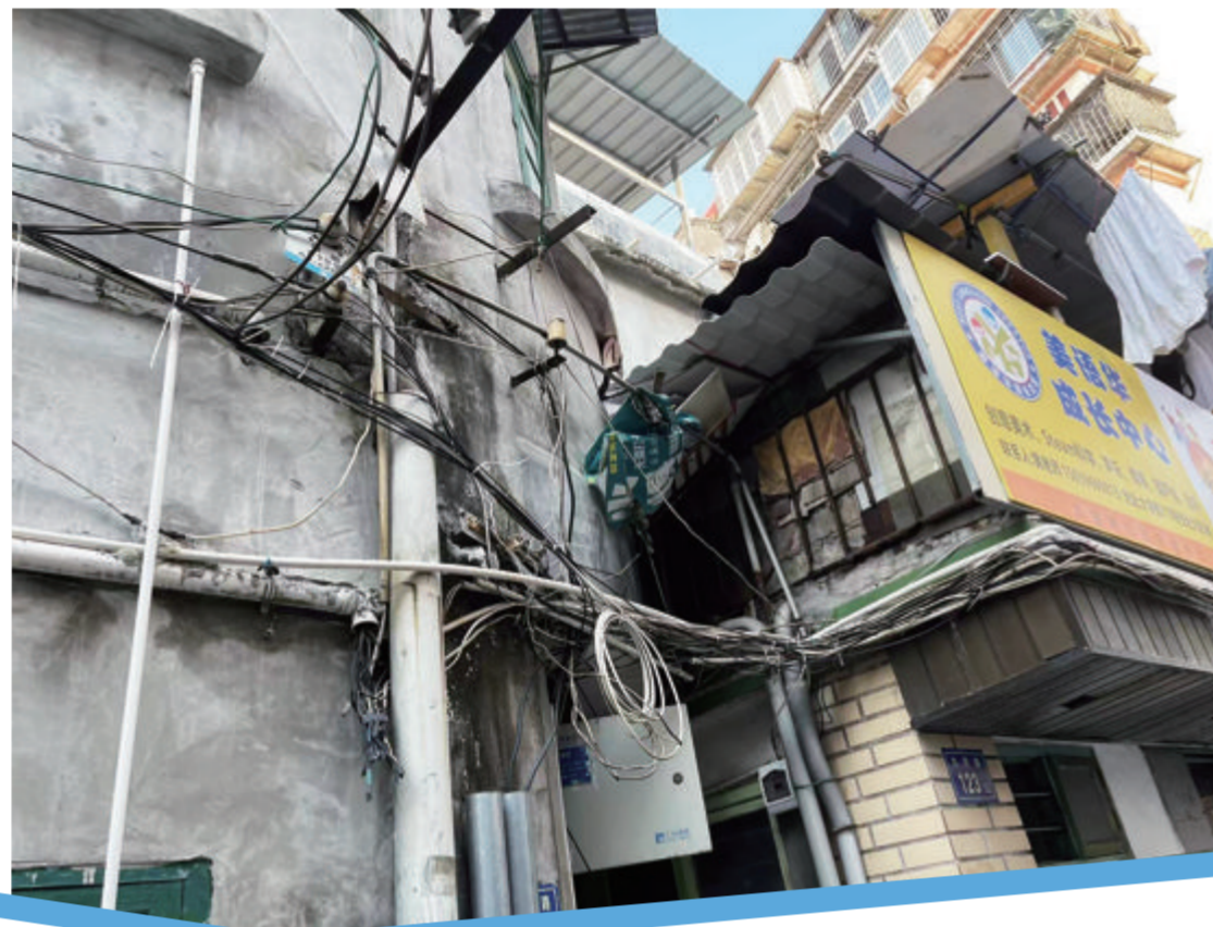
大学路121号至123号一带飞线杂乱。