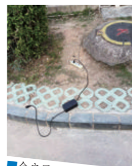
金安里39号飞线充电。