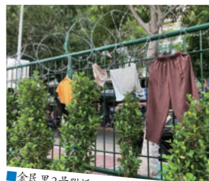
金民里2号附近不文明晾晒。