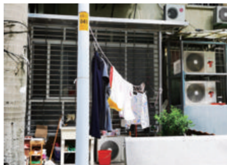
居民借助路灯杆拉线晾晒衣物。

在石亭路145号边的小区垃圾分类投放点对面,路边有建筑土头垃圾、泡沫等杂物混杂成堆,虽然现场用水马围挡着,但是这个垃圾堆在通道边,而且这里人来人往,显得大煞风景。周围的居民告诉记者,这是附近装修产生的临时垃圾堆,等垃圾数量累积多了,会有车辆前来清运。同样是杂物堆放,在石亭路150号对面,数米长的绿化带上堆满了绿化垃圾,未进行清运。