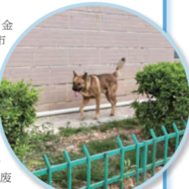
金安里39号附近存在不文明养宠现象。

另外,在金尚小区14栋靠近围栏一侧,几袋透明塑料袋装着生活垃圾扔在人行道上,较为影响市容。继续往前走,14栋的拐角处还有几袋垃圾丢弃在地上。