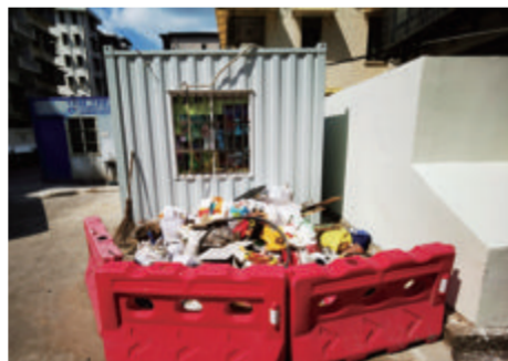
建筑垃圾露天堆放未及时处理。