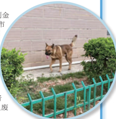
金安里39号附近存在不文明养宠现象。

在金安里39号的店铺外,一条电动车充电线从店内延伸出来,插线板搁在绿化带裸露的黄土上,充电器就放在路边。在同一地点,记者还注意到不文明养宠的情况,一条黄色的大狗无人牵引,独自游荡在马路和绿化带上,周围也没有看见宠物主人。