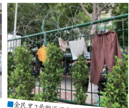
金民里2号附近不文明晾晒。