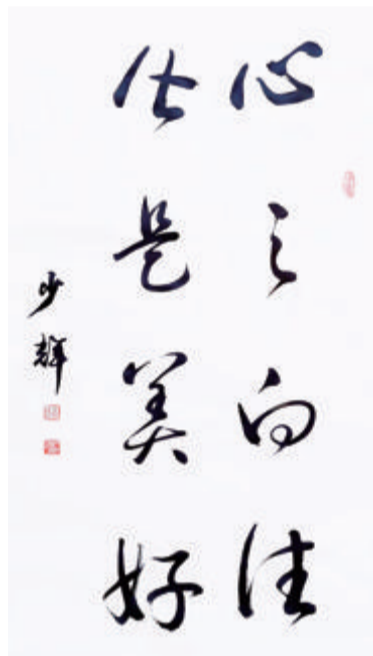
心之向往 皆是美好 赵少辉书