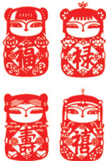
福禄寿禧 刘桂云 作