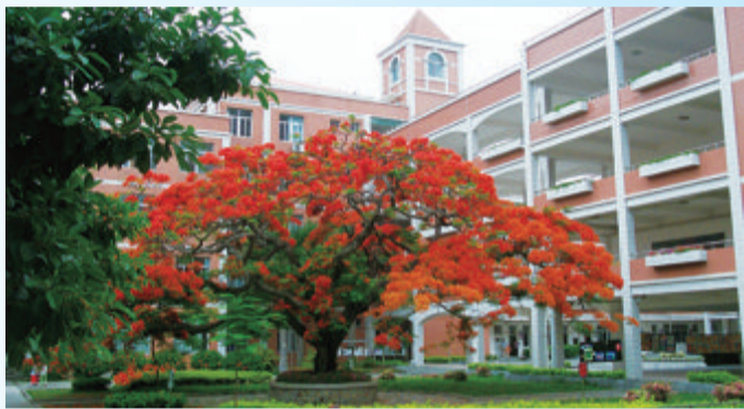
厦门实验小学内的老凤凰树。

着满树的红花,映照实小学子灿烂的前程。 虽然老凤凰树不在了,但它并未真正消失,它还在每一名实小学子的心中。我甚至怀疑,老凤凰树有一种神奇的魔力,在我们踏进实小的那一刻,就在我们的心中种下了一颗种子。这颗种子伴随我们的学习生涯,悄悄地生根发芽、茁壮成长,深深地扎根在我们幼小的心灵中。它时刻提醒我们,无论今后走向何方、从事什么工作,都要做一棵参天大树,为他人指引方向、遮风挡雨,成为对国家、对社会、对家庭有贡献的栋梁之材。