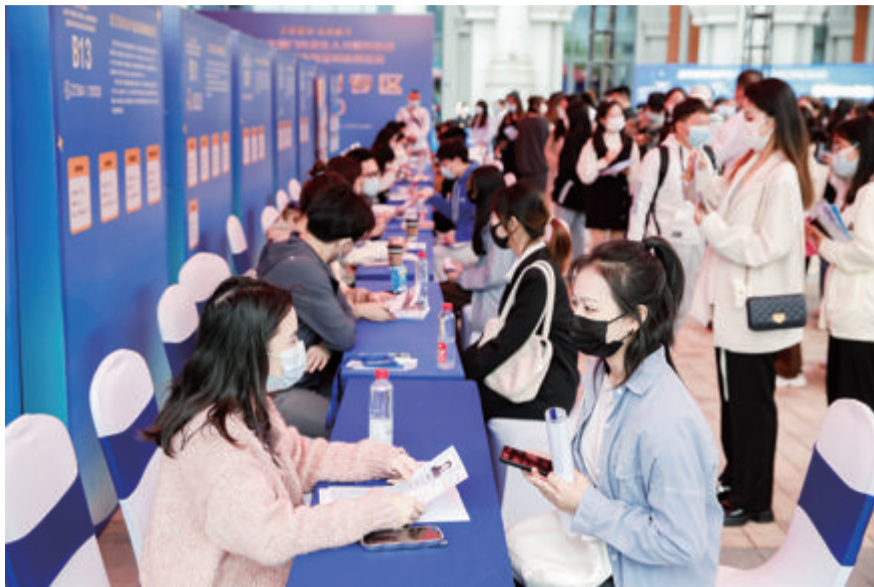
■现场招聘会上双向交流选择。