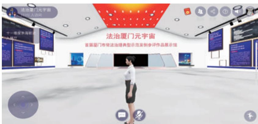
■市民可以虚拟方式进入“法治厦门元宇宙”展厅。