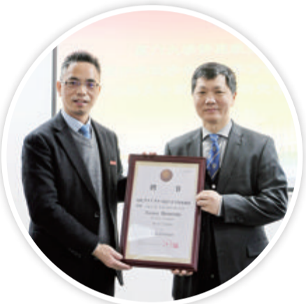
北京大学国际医院腹膜后肿瘤中心主任罗成华(右)受聘为厦门大学讲座教授,并指导厦大翔安医院开展复杂腹膜后肿瘤手术。