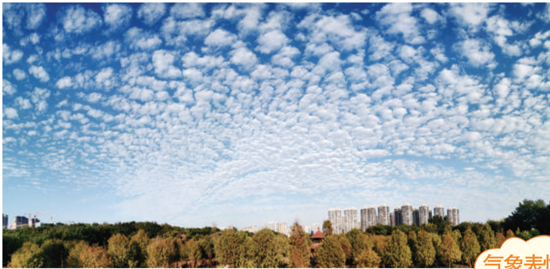
云的舞台