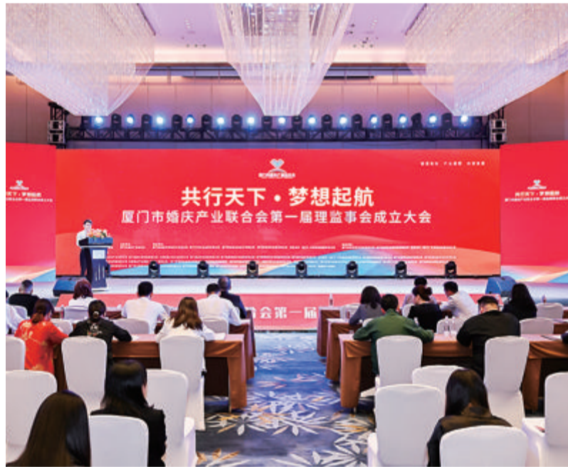
厦门市婚庆产业联合会成立大会举行。

本次论坛由厦门大学主办、厦大管理学院承办。中国旅游协会副会长、山东大学旅游产业研究院院长王德刚教授说,旅游业已进入技术升级、产业迭代、商业模式更新的新时代,新冠疫情仅仅是提前和加速了旅游业的蝶变和自我淘汰进程。厦大管理学院党委书记邱七星表示,旅游是综合性、带动性极强的产业,具有多领域、多产业、多区域融合发展的特点。引领旅游学术研究、打造旅游业界智库、推进旅游及相关产业协同升级、促进区域经济发展,是包括厦大在内的广大高校和科研机构积极可为的领域。