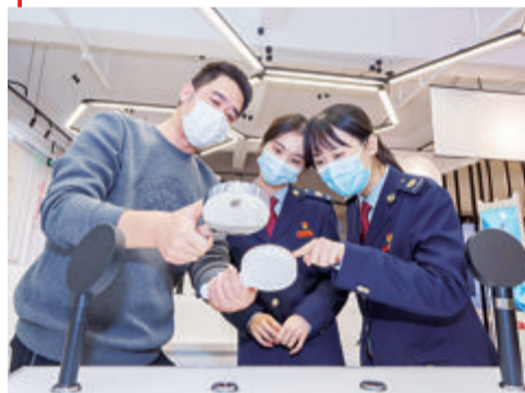
税务人员走访我市高新技术企业,宣传组合式税费支持政策。

本报讯(文/记者 郭舒晨 通讯员 晓筱 新宇 宋锐 图/黄亮)记者昨日从市税务局了解到,截至11月15日,我市有2.2万户制造业中小微企业享受缓缴税费35亿元。这相当于给企业带来一笔“无息贷款”,为处在发展关键期的制造业中小微企业提供有力资金支持,注入成长壮大的发展信心。