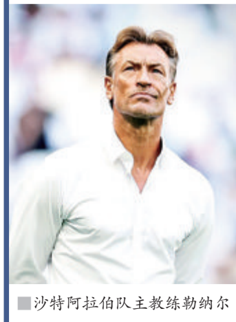
■沙特阿拉伯队主教练勒纳尔

据沙特阿拉伯电视台(Al Arabiya)报道,沙特国王萨勒曼宣布11月23日(周三)为所有员工和学生放假。