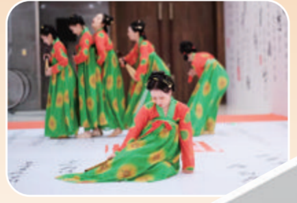
舞蹈《唐宫夜宴》