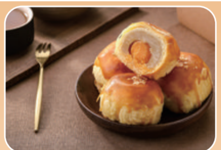
现场美食等您来品尝。

赏非遗技艺 漳州片仔癀、厦门八宝丹、永定万应茶、泉州莲花峰茶……各地传统中医药荟萃;厦门漆线雕、将乐柴窑陶瓷、漳州八宝印泥、南平建盏、莆田红木、德化白瓷……各具特色的工艺品争奇斗艳,让人目不暇接。