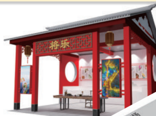
将乐特展馆效果图

厦门思明区与将乐,山海双向奔赴,将发挥各自的优势,助力乡村振兴,合力推动厦门思明、将乐两地老字号与传统品牌共同实现更高质量的发展。