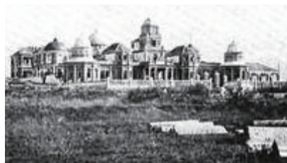
■ 陈嘉庚创办的幼稚园

他提出幼稚教育“12信条”:幼稚教育是教育的基础,幼稚教育要以儿童为中心,幼稚教师是儿童的伴侣,幼稚园应成为“儿童的乐园”,幼稚教育负有改造家庭的责任等。近百年前,嘉庚先生就提出如此超前的观点,可见其眼光之深远见解之独到。