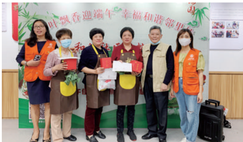
瑞景公园小区第一党支部组织端午节主题活动。