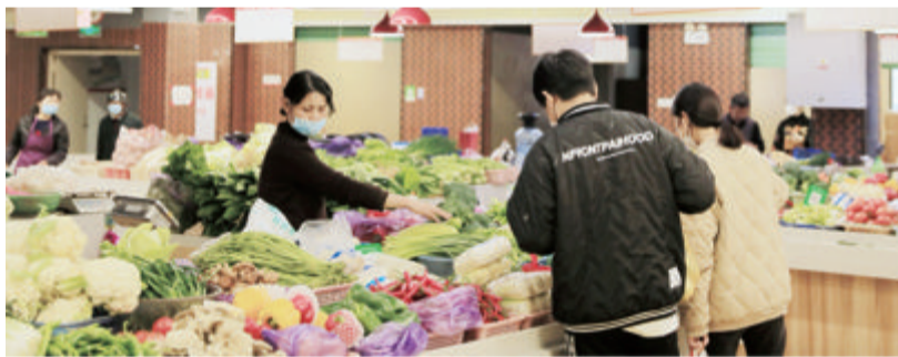
马巷中心市场实行分区经营,人气旺。

“烟火气”的同时,打造一个“现代化超市”般的新市场,全力打造一个服务民生、有序经营、规范管理、联动协同、物