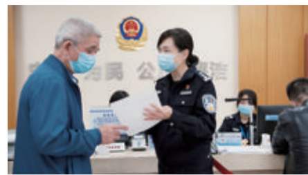
莲前派出所民警贴心为居民服务。

本报讯(记者 吕嘉捷 通讯员 厦公宣)由公安部主办的第六次全国“公安楷模”发布活动近日举行,厦门市公安局思明分局莲前派出所荣获全国“公安楷模”,该所是我省唯一获此荣誉的公安集体。