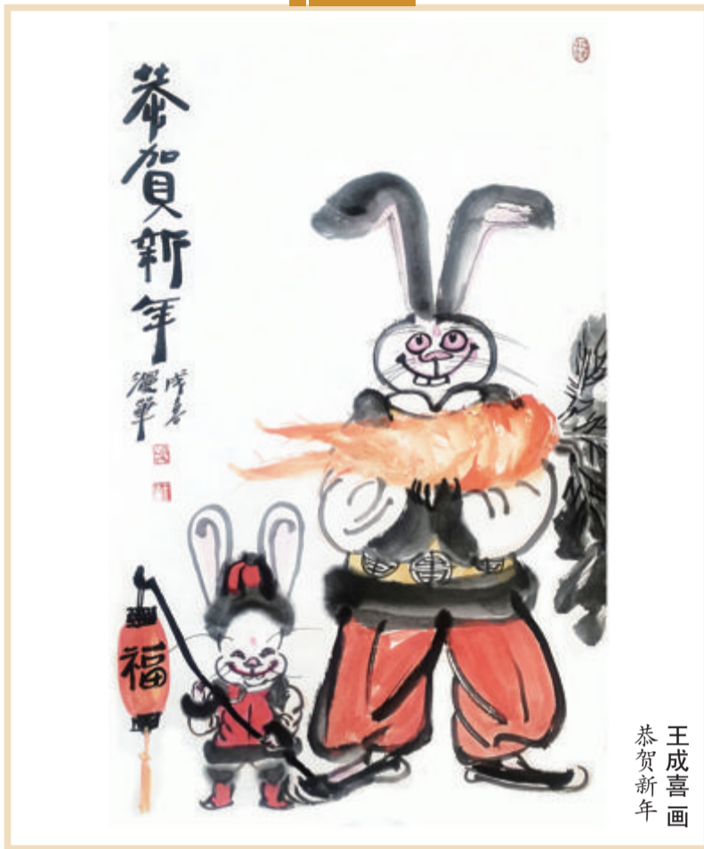
王成喜画 恭贺新年