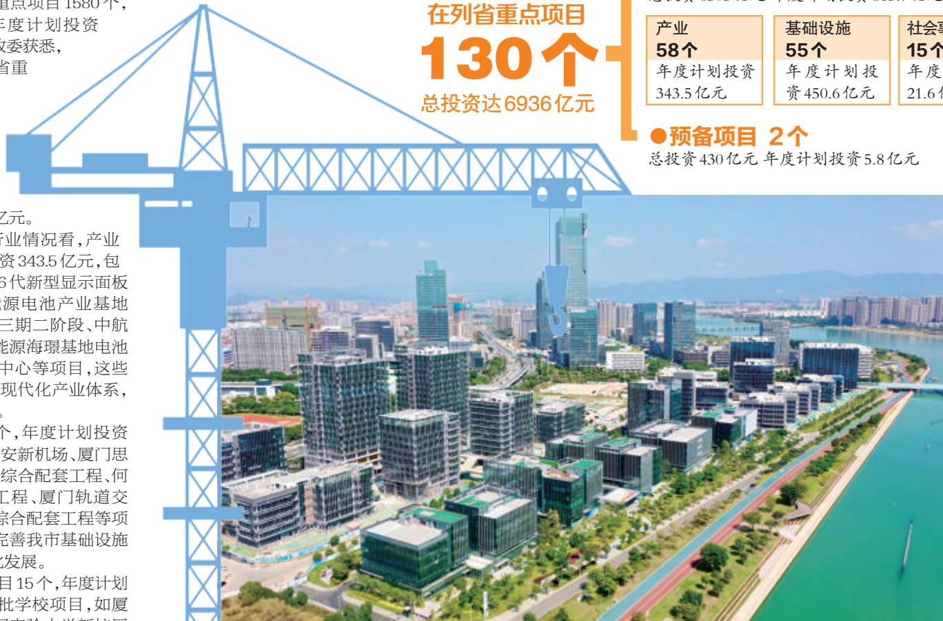
◀ 厦门新经济产业园等城市服务业配套项目的建设,将进一步增进我市民生福祉。