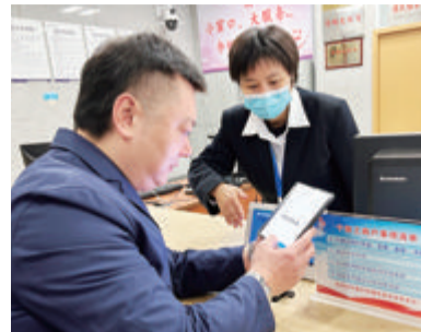
工作人员指导经营者现场办理事项。

本报讯(文/图 记者 戴懿)昨日起,思明区的个体工商户可就近到街道便民服务中心办理相关登记事项。思明区行政审批管理局会同市场监督管理等部门,将个体工商户办理事项下沉到街道便民服务中心,助力小微主体创业发展。