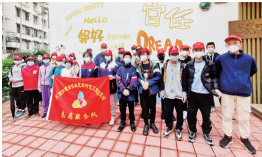
社区近邻服务增加邻里往来、加深邻里友情。 资料图

未来,我市还将打造“数字近邻”智慧社区服务平台,构建“1+1+1+N”的服务模块,即建设一个一体化智慧社区平台、构建一个统一的数据支撑体系、搭建一个智慧社区治理模块、构筑N个社区数字服务场景等,集约建设便民惠民智慧服务圈,不断提升城乡社区治理服务智慧化、智能化水平。