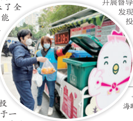
垃圾分类车的海鸥形象很萌。