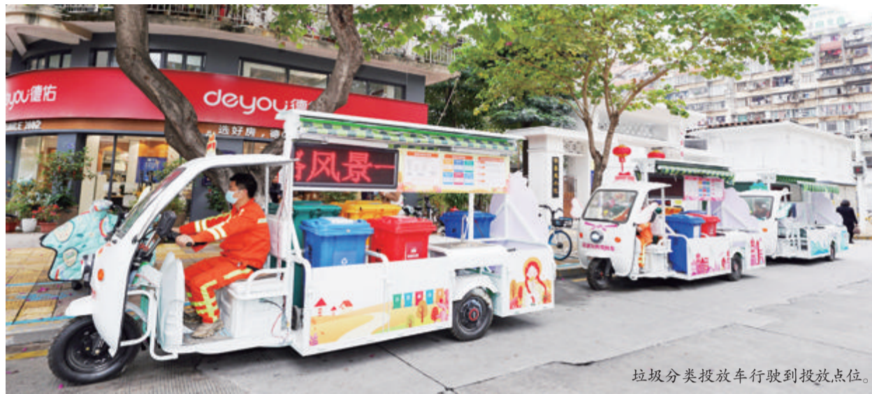
垃圾分类投放车行驶到投放点位。

定时投放时间一到,化身绿海鸥的垃圾分类投放车行驶到投放点。它萌趣的造型、灵动的眼神,为居民的日常投放带来了全新的体验,既能美化环境,又能流动宣传。