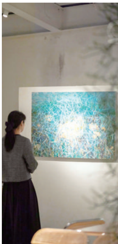
■“春和景明”春季当代青年艺术家群展在东坪山开展,以鲜艳的色彩向观众展现春天万物勃发的活力。

本报讯(文/图 记者 龚小莞)“春和景明”春季当代青年艺术家群展日前在东坪山东山社75号开展,展出15位画家的39幅作品。他们主要以自然物为创作对象,作品包括油画、水墨画、丙烯画等,以鲜艳的色彩向观众展现春天万物勃发的活力。