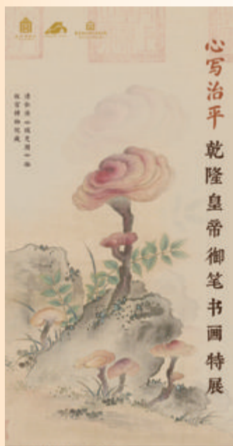
心写治平 乾隆皇帝御笔书画特展