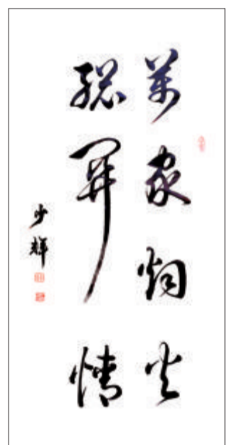
万家烟火总关情 赵少辉书