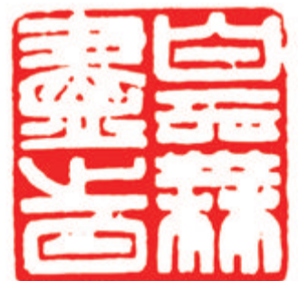
白云无尽时 马广生刻