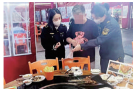
■执法人员要求店家引导消费者合理点餐。

本报讯(文/记者 高金环 通讯员 张弥陈茂帝 朱英华 图/市场监管)近日,两家存在未采取措施防止食品浪费等违法行为的餐厅,被思明区市场监管局给予警告行政处罚。