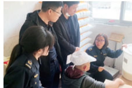
■执法人员开展现场检查。

本报讯(文/记者 高金环 通讯员 王慧图/市场监管)近日,翔安区一所中学食堂被因设备配置不足、硬件老化、管理不到位等食品安全隐患,被市场监管部门责令停业整改。