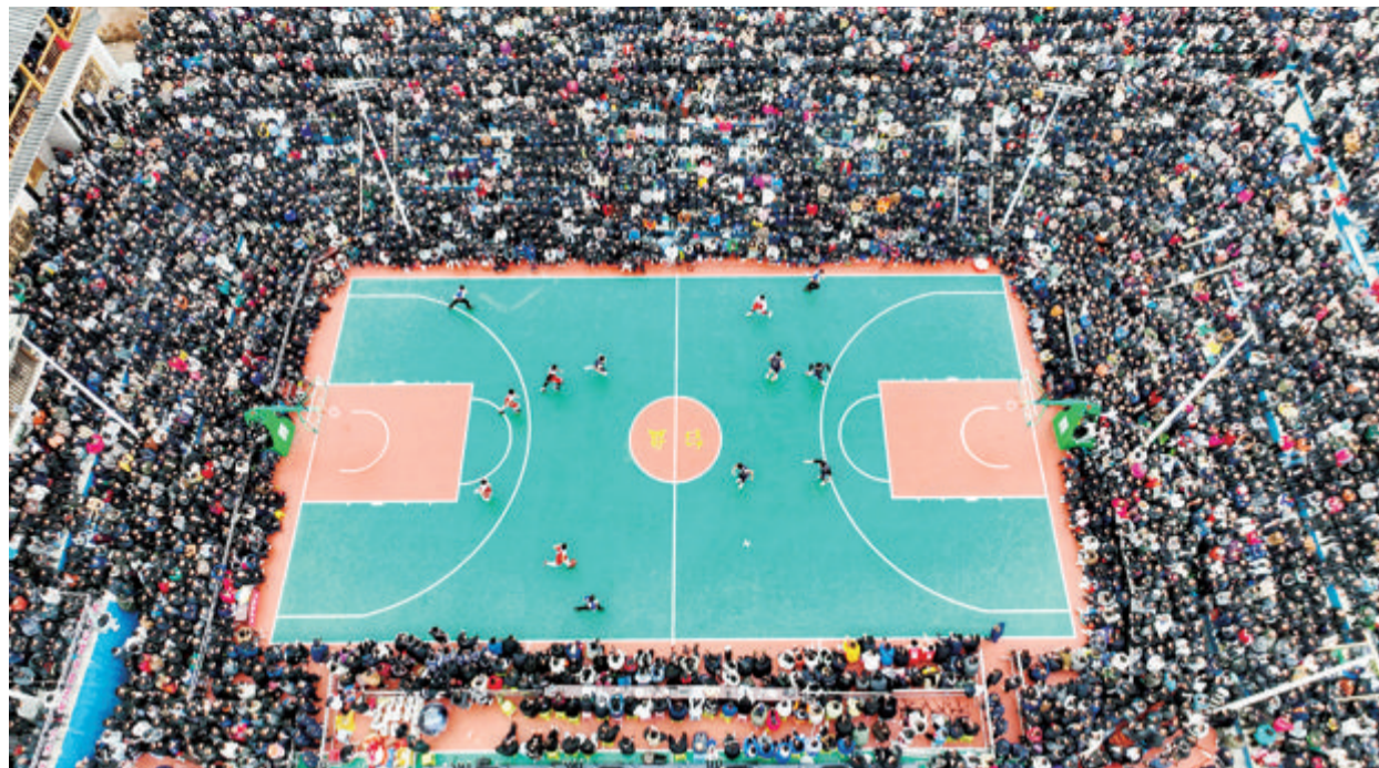
■3月27日比赛现场。