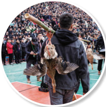
■3月27日,工作人员挑着当地农产品“三穗麻鸭”进入赛场。这是季军铜仁市代表队的奖品。

在现场,苗族非遗古歌、苗族舞蹈以及芦笙等民族乐器的演奏,赋予了“村BA”又一抹亮色。而被誉为东方迪斯科的“反排木鼓舞”一旦出场,气氛就会彻底被点燃。 今年,贵州省首届“美丽乡村”篮球联赛总决赛落户台盘村举办,野性与乡土气依旧不减。决赛后的颁奖典礼上,遍地跑的“三穗麻鸭”、台江鲤鱼吻香米、台江鲟鱼