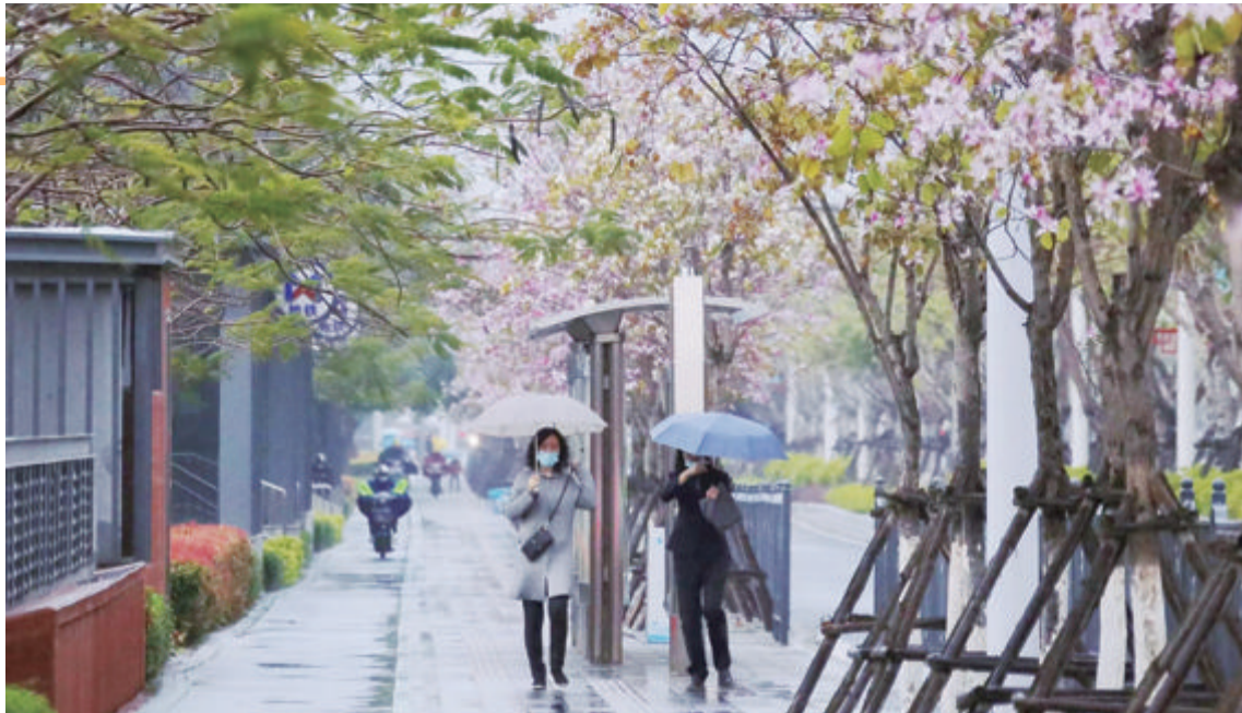
雨雾 石屋摄于湖滨北路