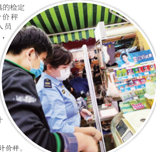
执法人员现场检查超市计价秤。

经厦门市衡器检定站出具的检定结果通知书显示,该电子计价秤为不合格计量器具。执法人员将报告依法送达该超市后,超市相关负责人表示无异议,且无法提供涉案不合格电子计价秤的购进票据以及供货商相关资质证明材料。根据《中华人民共和国计量法实施细则》相关规定,江头市场监管所依法对该超市处以罚款并向该超市相关人员普及计量法律法规。