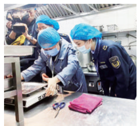
检查人员对火锅店菜品复称检查。

本报讯(文/记者 高金环 通讯员 朱英华 林莉莉 图/市场监管)近日,思明区市场监管局对火锅餐饮店开展计量行为专项检查,切实保护消费者合法权益,营造诚实守信经营氛围。