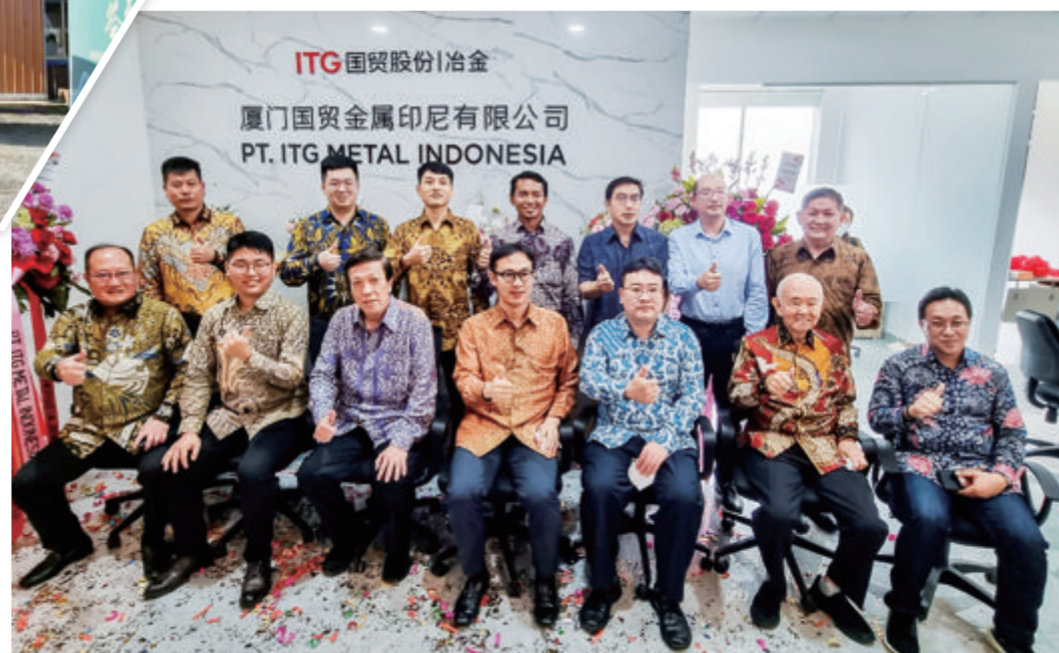
厦门国贸金属印尼有限公司揭牌仪式。