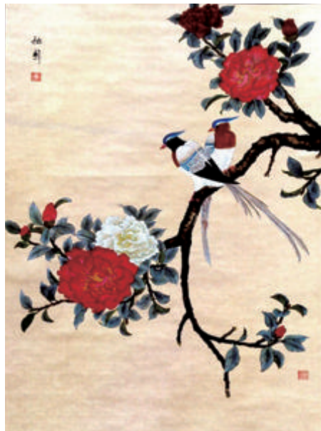
富贵白头 张旭辉 画