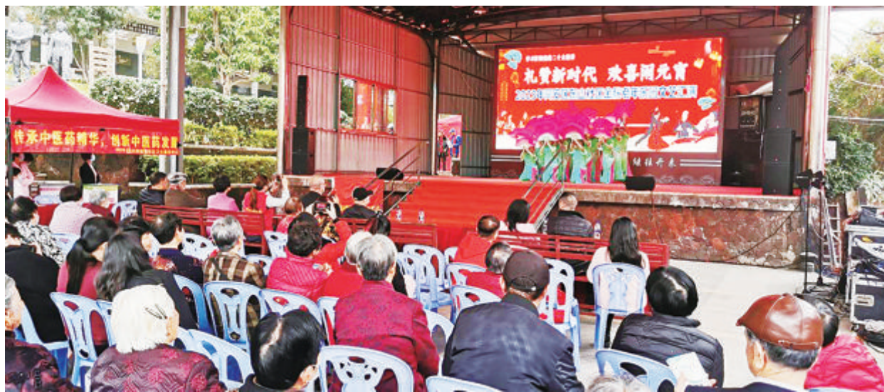
同安金秋老年乐园开展各具特色的活动,丰富基层老年人的文体生活。

本报讯(记者 吴笛 通讯员 林穆生)我市各区现有金秋老年乐园57个,其中同安区19个,占比达三分之一。记者从近日召开的2023年厦门市金秋老年乐园工作交流会上获悉,近年来,同安区多个社区的金秋老年乐园开展各具特色的活动,进一步营造“尊老、敬老、爱老、助老”的社会氛围,让老年人老有所为、老有所学、老有所乐、老有所安。