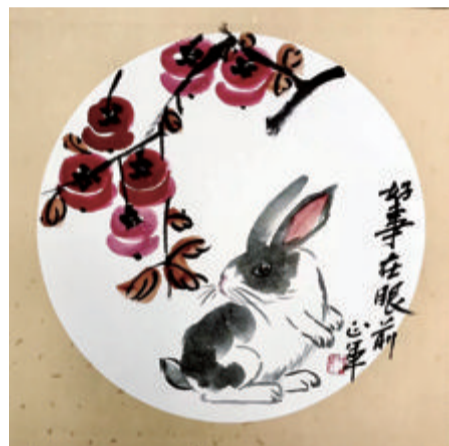
好事在眼前 俞正军 画