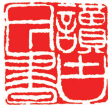
读古今书 徐锐 刻