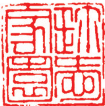
珍爱家园 白素菊刻