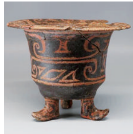
■北京丰台新宫遗址大坨头文化墓葬M75出土的靴形足彩陶尊。