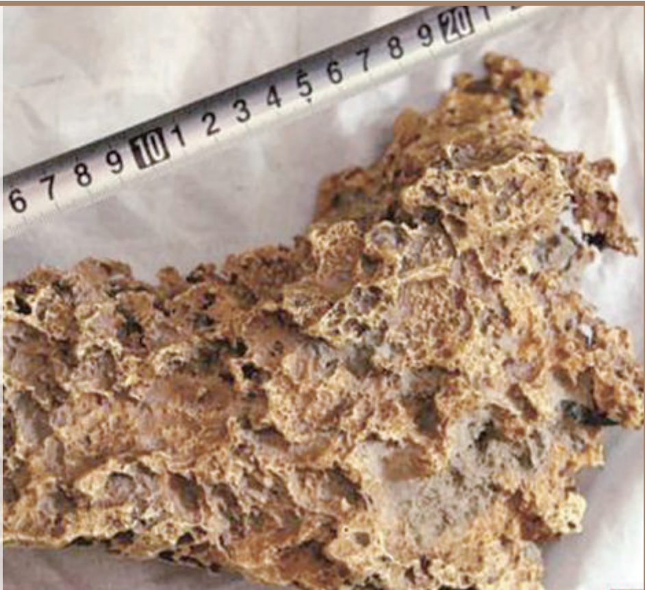
■我国发现的最大天然金块,长约23厘米,最宽处约18厘米,最厚处约8厘米。