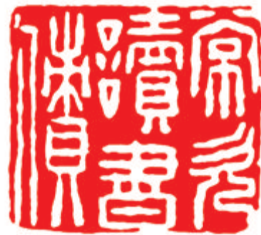
常欠读书债 徐成文刻