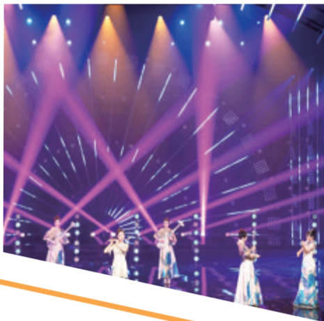
海峡影视季晚会在厦门举行。